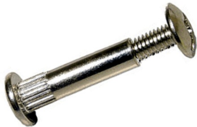
С - стяжка мб