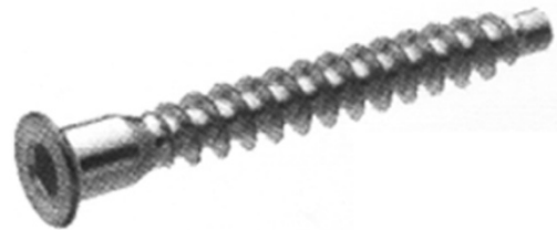
К - конфірмат